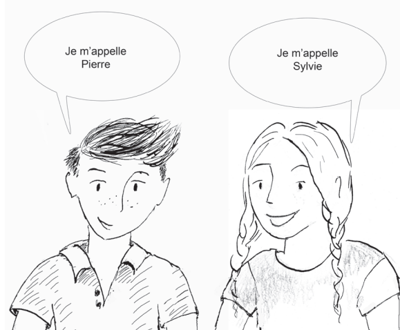
Illustratie: Jacomien de Bruijne