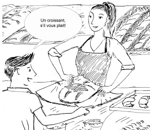
Illustratie: Jacomien de Bruijne